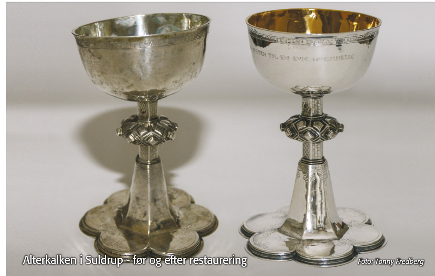
Alterkalken i Suldrup – før og efter restaurering

Kirkebilen kan også bestilles til gudstjenesterne på Himmerlandshave på tlf. 98 37 11 50.